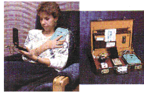
Le Système RHUMART® Miniature, MBI-1000

“Rares sont ceux qui voient avec leurs propres yeux et ressentent avec leur propre cœur” (A. Einstein)